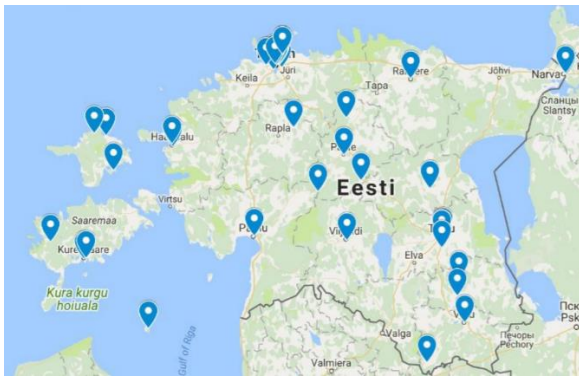
Joonis 1 Muuseumide hoidlate paiknemine Eestis. Eristuvad saartel paiknevad hoidlad, Lõuna-Eestis Tartu lähistele koondunud hoidlad ning Põhja-Eestis Tallinna juurde koondunud hoidlad.